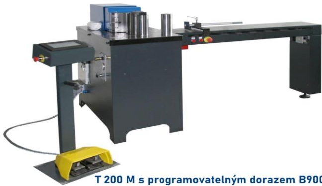
T 200 M s programovatelným dorazem B900